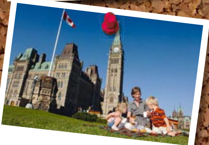
Parliament Hill, Ottawa, Ontario

Bis Ende 2014 will Canadian Hydro in einer ersten Phase des Projekts Windräder mit einer Leistung von 400 bis 500 Megawatt aufstellen. Wann das Endausbauziel erreicht wird, ist allerdings noch offen. Canadian Hydro ist der größte Anbieter für erneuerbare Energien in Kanada. Das Unternehmen betreibt unter anderem zwölf Wasserkraftwerke und acht Windparks. ■