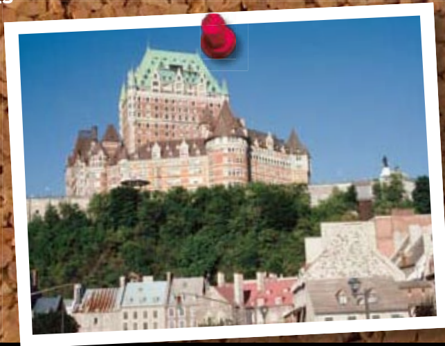
Spaziergang durch Québec