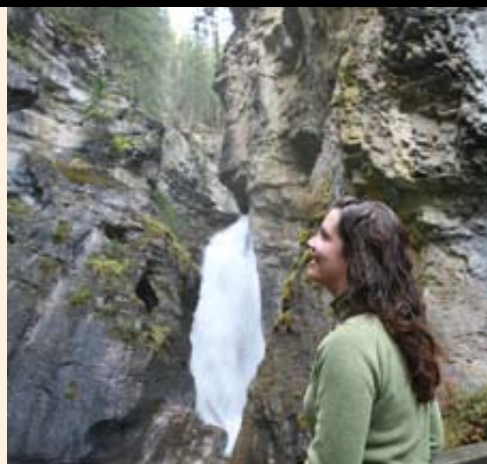
Wandern im Jasper National Park