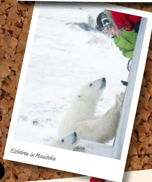
Eisbären in Manitoba

Infos unter: www3.nf.sympatico.ca/cupidshistorical ■