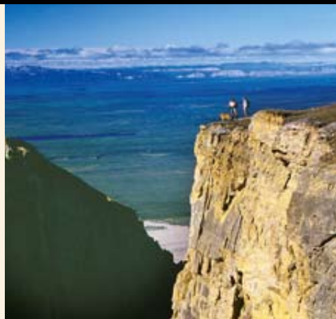
Ein Traum wird wahr