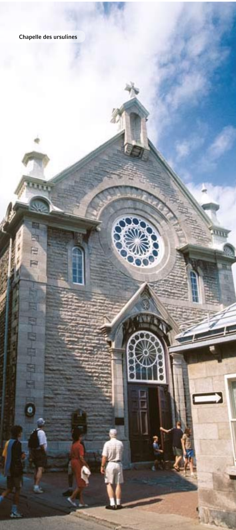
Chapelle des ursulines

S ei es das Chateau Frontenac, das traditionsreiche Luxus-hotel, das unübersehbar auf dem Cap Diamant über dem Sankt Lorenz Strom thront, seien es die Ebenen von Abraham vor den Toren der Stadt, auf denen die Entscheidungsschlacht zwischen Franzosen und Briten um den nordamerikanischen Kontinent stattfand, oder seien es die alten Straßen im Quartier Petit Champlain unterhalb des Stadthügels, wo Samuel de Champlain sein erstes Palisadenfort aus Holz errichtete – alles zeugt von der ruhmreichen Vergangenheit der Hauptstadt der Provinz Québec. Hier entstanden die ersten Schulen und Universitäten, von hier brachen die Entdecker auf, um die Gebiete westlich des bekannten Siedlungsbereichs zu erkunden. Hier kamen aber auch die Vertreter der kolonialen Verwaltung an, um die Vorstellungen der Heimatregierung vom Leben in den Kolonien durchzusetzen. Zeugen dieser Ereignisse sind die Kirchen, Schulgebäude und Universitäten, die noch heute von der Oberstadt auf den Sankt Lorenz Strom hinaus blicken. Und die ganze Unterstadt Québec erweckt den Eindruck einer historisch gewachsenen Stadt, in der man noch die Spuren der Gründer zu finden glaubt, auch wenn diese schon längst unter dem Nebel der Zeit verschwunden sind.