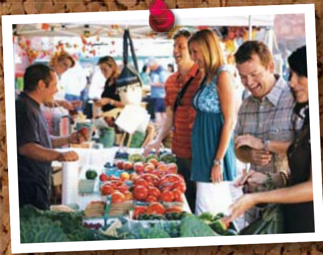
Distillery District, Toronto